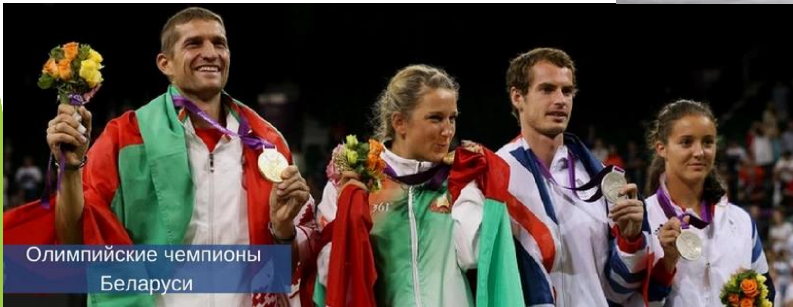
Олимпийские чемпионы Беларуси